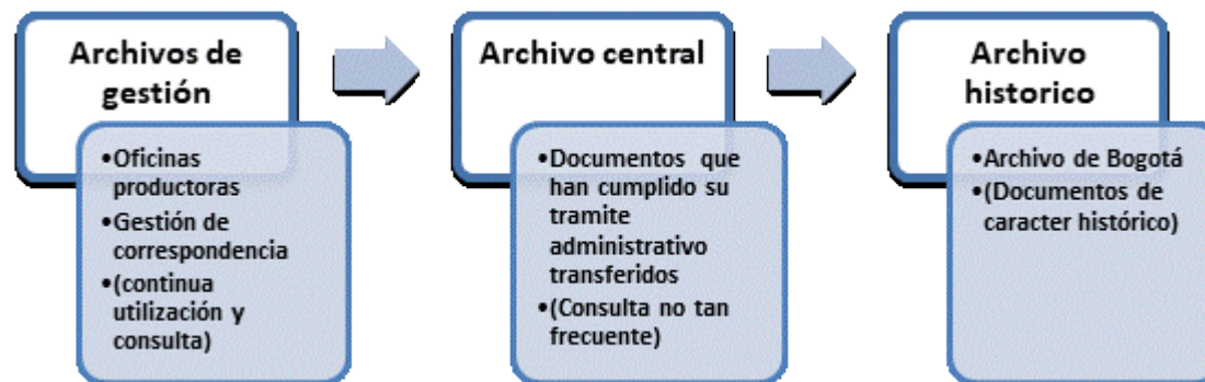
Ilustración 1 Estructura de Archivos