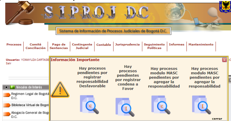
Imagen No. 1 Pantallazo de reporte en SIPROJ

Por lo anterior, se recomienda registrar todas las actuaciones administrativas de los procesos y diligenciar en el aplicativo SIPROJ la observación correspondiente de cada una de estas actuaciones tal como lo expresa el manual del usuario en la sección de pagos: “ En la casilla de observaciones se debe ingresar la información que se considere pertinente, como el nombre de la persona o institución a la cual se le efectuó el pago, cédula, NIT, etc., o se puede registrar cualquier aclaración que sea procedente y relevante a la hora de solicitar o consultar la ficha de pago ”.