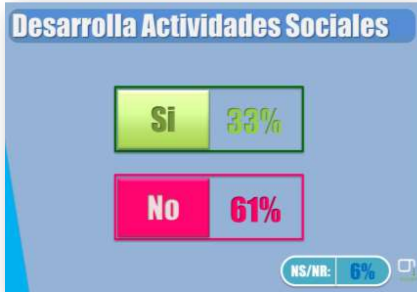
Gráfica sobre la participación en actividades sociales