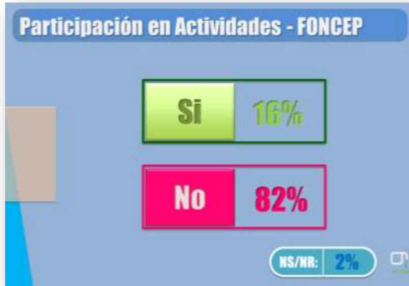
Gráfica sobre la participación de los pensionados en actividades desarrolladas por FONCEP.