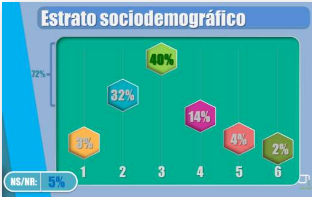
Gráfica sobre los estratos en los que se clasifica las viviendas de los pensionados

Tan solo el 20% de la población pertenece a los estratos medio, medio alto y alto, indicando que de este último solo su representación es de 2%.