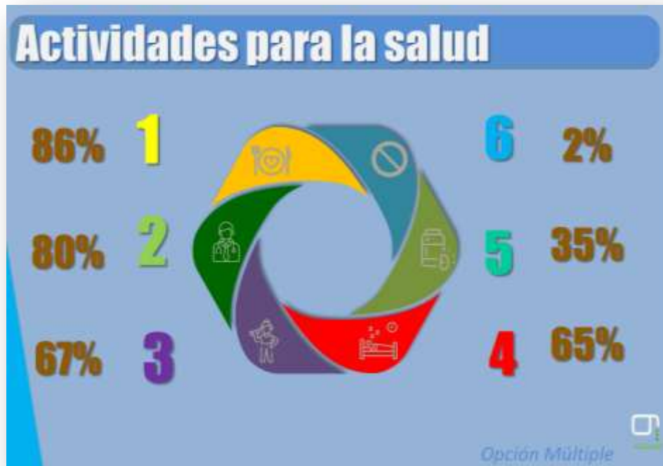
Gráfica sobre las actividades para cuidar la salud

Así las cosas, la alimentación sana y la asistencia al médico son las actividades de mayor incidencia entre los encuestados.