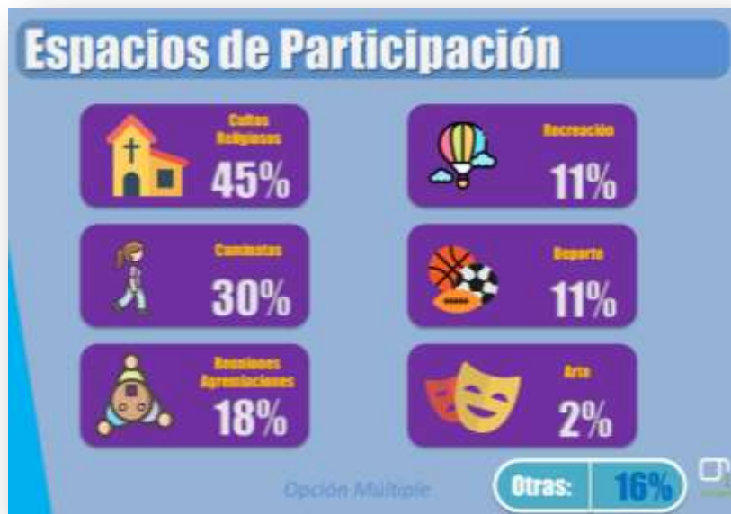
Gráfica sobre los espacios de participación

La recreación comunitaria y las organizaciones artísticas son las categorías que menos peso tienen pero que se configuran en actividades de participación de los pensionados.