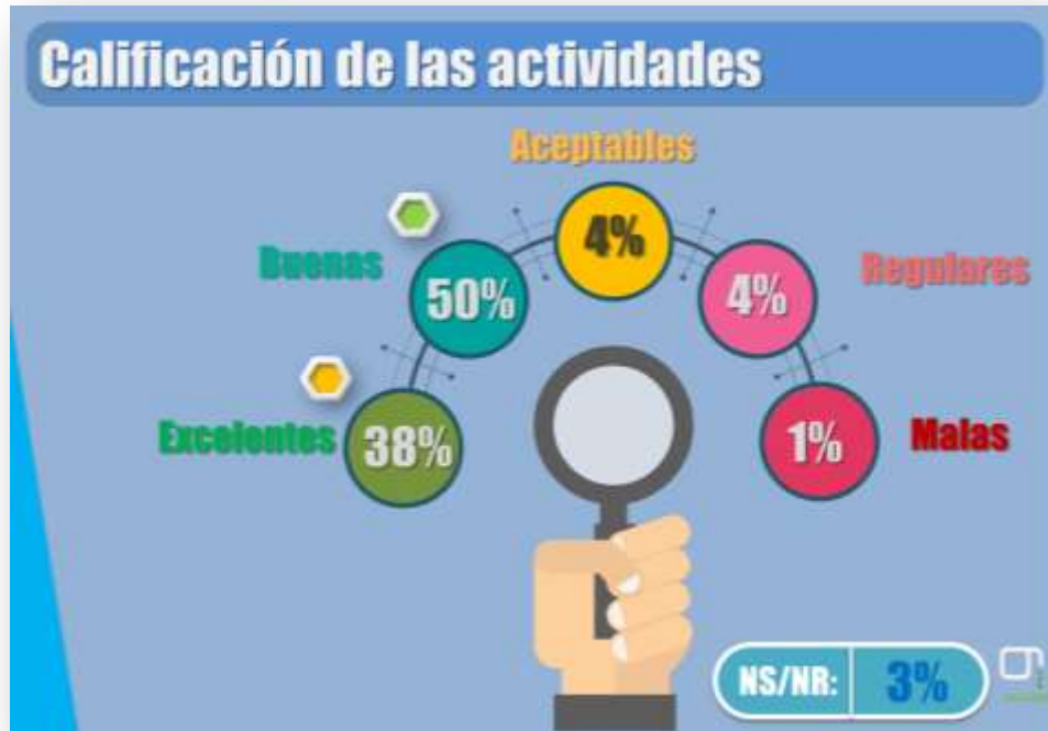
Gráfica sobre la calificación que los pensionados otorgan a las actividades desarrolladas por FONCEP.

Se aprecia que las actividades son calificadas como buenas por la mitad de los encuestados. Un 38% de encuestados, cantidad importante, opina que las actividades han sido excelentes.