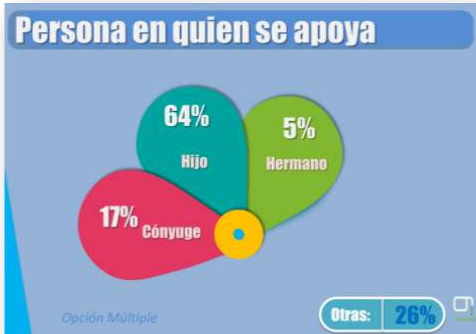
Gráfica del apoyo requerido por alguna persona para la movilización