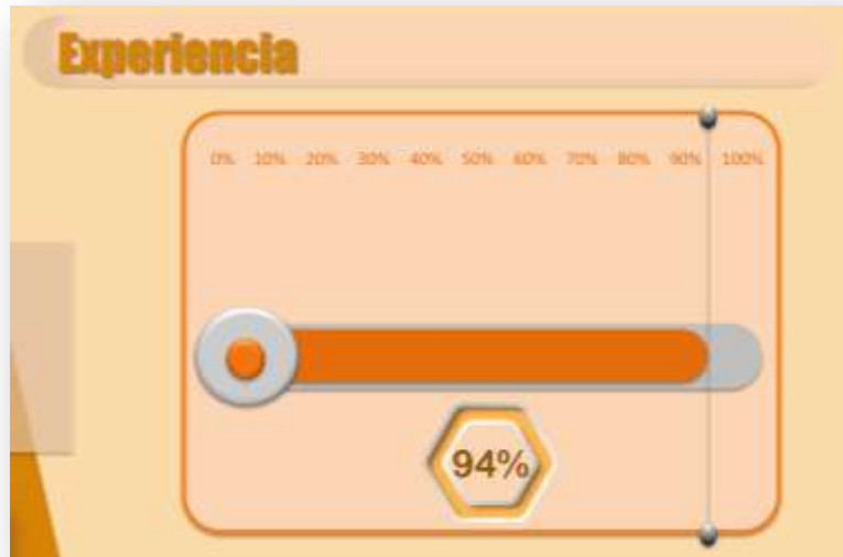
Gráfica sobre la calificación de la experiencia de los pensionados con FONCEP