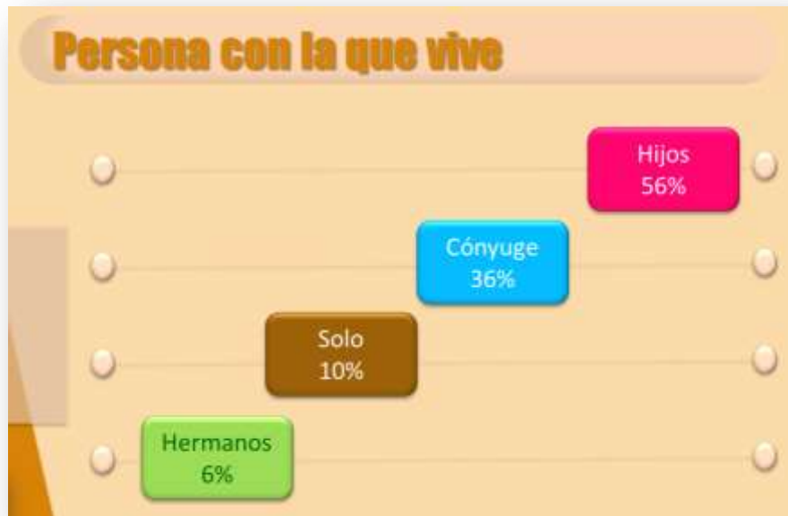
Gráfica sobre las personas con las que convive el pensionado