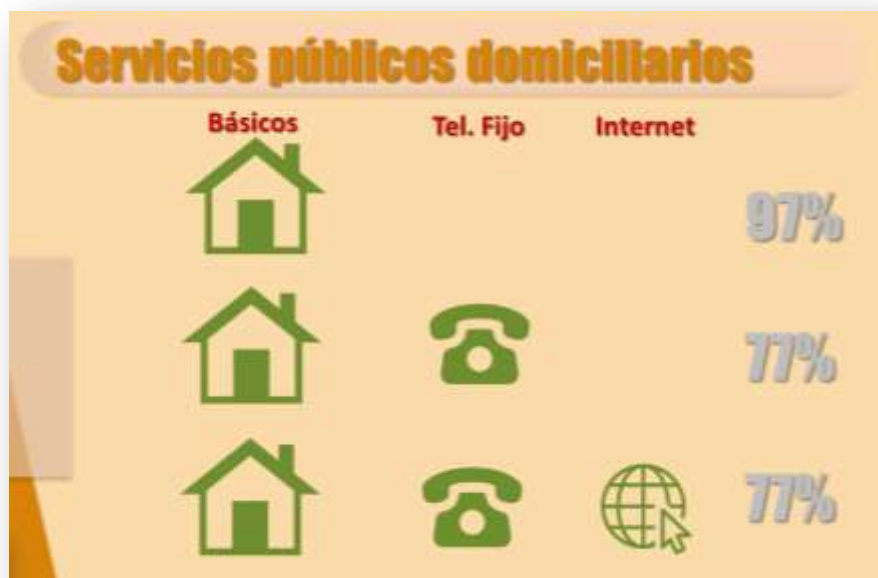
Gráfica sobre la presencia de servicios públicos domiciliarios