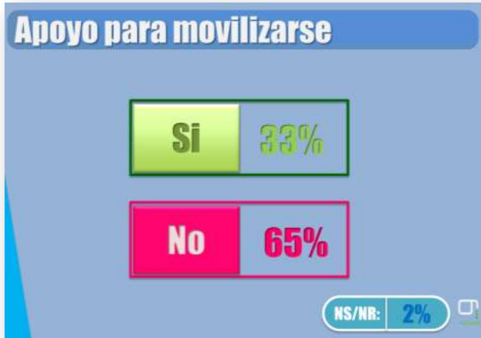
Gráfica sobre la necesidad de apoyo para movilizarse