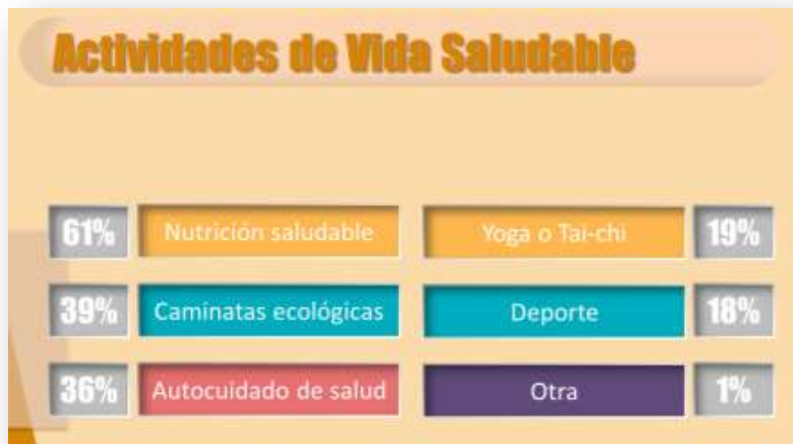
Gráfica sobre intereses en actividades de vida saludable. Muestra: 1342 personas interesadas en estas actividades (42%)

De otro lado, las actividades de Yoga y la práctica de algún deporte son las que menos preferencia han logrado dentro de los encuestados.