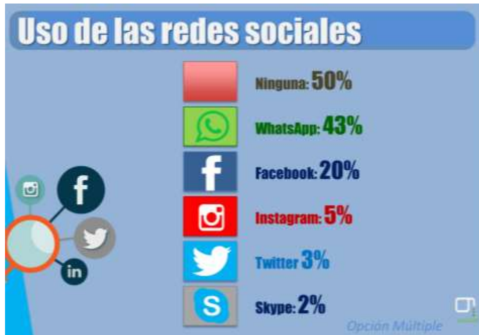
Gráfica sobre el uso de aplicaciones virtuales