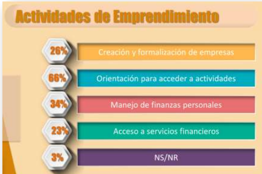
Gráfica sobre intereses en actividades de emprendimiento. Muestra: 468 personas interesadas en estas actividades (15%)

La creación y formalización de empresas así como el acceso a servicios financieros despertaron menor interés dentro de los encuestados.