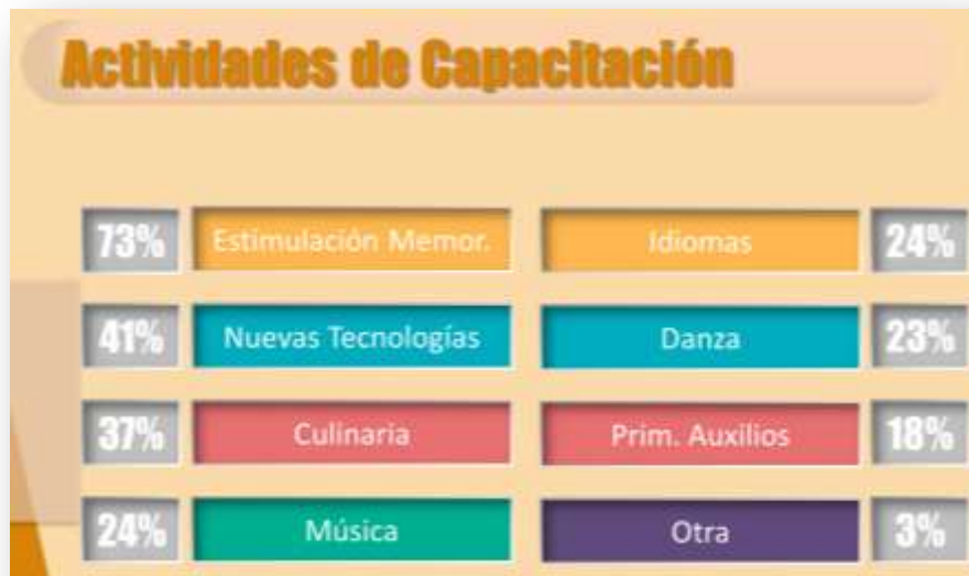
Gráfica sobre intereses en actividades de capacitación. Muestra: 719 personas interesadas en estas actividades (22%)