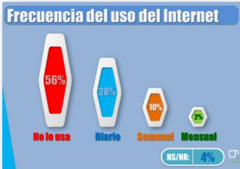
Gráfica sobre el uso del Internet por los pensionados

Tal como se evidencia arriba, el uso del Internet no está generalizado. Tan solo el 40% hace uso de este servicio y solo el 28% hace uso diario.