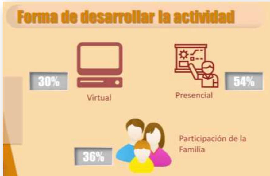
Gráfica sobre la forma de desarrollar las actividades. Muestra: 2417 personas interesadas en estas actividades (75%)