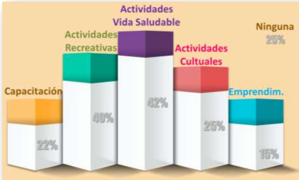
Gráfica de actividades de interés

Menos interés suscitó el área relacionada con actividades de emprendimiento, mejora y manejo de ingresos.