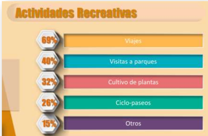
Gráfica sobre intereses en actividades Recreativas. Muestra: 1329 personas interesadas en estas actividades (41%)